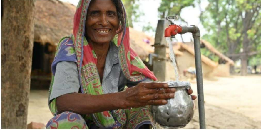
Uttar Pradesh News: UP became the second state to provide maximum tap connections in the country

Uttar Pradesh News: जलशक्ति मंत्री ने पूरी टीम को दी बधाई