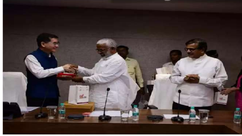
जलशक्ति मंत्री से मिलने जलजीवन मिशन

लखनऊ: उत्तर प्रदेश में जल जीवन मिशन और नमामि गंगे योजना को मजबूती देने और टेक्निकल साझेदार के रूप में सहयोग प्रदान करने के लिए सिंगापुर से आए प्रतिनिधिमण्डल ने बुधवार को जल शक्ति मंत्री स्वतंत्र देव सिंह से मुलाकात की। इस विशेष बैठक में सिंगापुर के आयोध्या प्रोजेक्ट के तहत किए जा रहे कार्यों पर चर्चा हुई। जल शक्ति मंत्री ने सिंगापुर से आए सदस्यों को बताया कि प्रधानमंत्री नरेन्द्र मोदी के मार्गदर्शन और मुख्यमंत्री योगी आदित्यनाथ के नेतृत्व में विकास की परिवर्तन यात्रा में यूपी तीव्र गति से आगे बढ़ रहा है। जल जीवन मिशन के तहत यूपी में एक करोड़ से अधिक परिवारों को नल से जल पहुंचाया गया है।