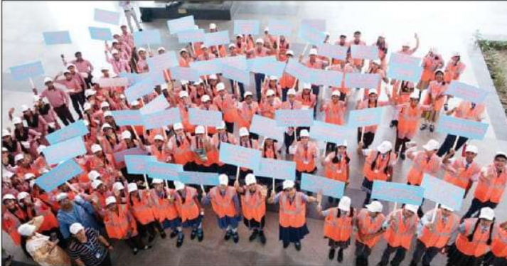
यूप 5 संवाददाता

लखनऊ। अरे मोहिनी देखो इस मशीन से पानी कैसे ड्रट से साफ हो रहा है। अरे कपिल यहाँ तो एक मिन्ट से भी कम समय में इंट चकनाचूर हो रही। कुछ ऐसा ही नजारा जल ज्ञान यात्रा के दौरान देखने को मिला जब छात्र-छात्राओं ने जल जीवन मिशन से जुड़ी परियोजनाओं को नजदीक से जाना। नमामि गंगे एवं ग्रामीण जलापूर्ति विभाग की ओर से आयोजित जल ज्ञान यात्रा में छात्र-छात्राओं ने उत्सुकता संग जल निगम की प्रयोगशाला, ओएचटी, एसटीपी, मेटेरियल टैरिंटिंग लैब की कार्यप्रणाली को समझा। राज्य पेयजल एवं स्वच्छता मिशन के किसान बाजार स्थित कार्यालय से गुरुवार को जल ज्ञान यात्रा का शुभारंभ किया गया। जिसके तहत सरकारी व प्राइवेट स्कूल के लगभग 150 छात्र-छात्राओं का दल लखनऊ में जल जीवन मिशन की परियोजनाओं के शैक्षिक भ्रमण पर गया। आखों में चमक, हाथों में जल से जुड़े रोचक स्लोगन, मन में कई सवाल, बड़ी-बड़ी मशीनों को देख आश्चर्यचकित बच्चों का स्वागत तिलक लगाकर किया गया। जल संरक्षण, जल