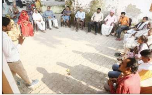
ग्रुप 5 संवाददाता