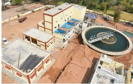
खार टूटने पर पानी से बचने वाली बुंदेलखंड की तस्वीर

ललितपुर। ललितपुर के डुलावन और कमरई गांव में पीने के पानी की समस्या नहीं रहेगी। जल जीवन मिशन की योजना से गांव में घर-घर तक नल कनेक्शन पहुंच गये हैं। बहुत जल्द इस गांव में जल की सपनाई भी पहुंचने वाली है। कभी इस गांव में एकमात्र तालाब पीने के पानी का मुख्य स्रोत हुआ करता था।