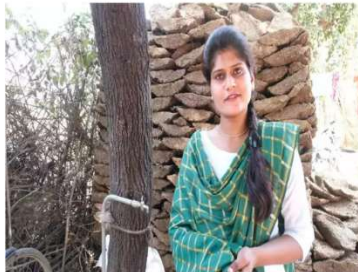
एफटीके प्रशिक्षित महिला रानी

बता दें कि ललितपुर की कचनीदा बांध परियोजना से 1,45,324 जनसंख्या को सीधा लाभ मिलेगा। इसमें 25,504 गृह संयोजनों की संख्या है। परियोजना से जुड़े गांवों में घर-घर तक नल कनेक्शन हो गए हैं। कई गांव में पानी सप्लाई भी दी जा रही है। जिन गांव में सप्लाई नहीं पहुंची है बहुत जल्द वहां सप्लाई देने की तैयारी अंतिम चरणों में है। कचनीदा कलां स्कीम से 62 गांव को पानी की सप्लाई की जाएगी।