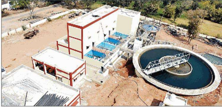
ललितपुर : वाटर ट्रीटमेंट प्लांट।

अन्तिम चरण में पहुँची कचनौंदा स्कीम से 3000 की आबादी को पेयजल आपूर्ति की योजना