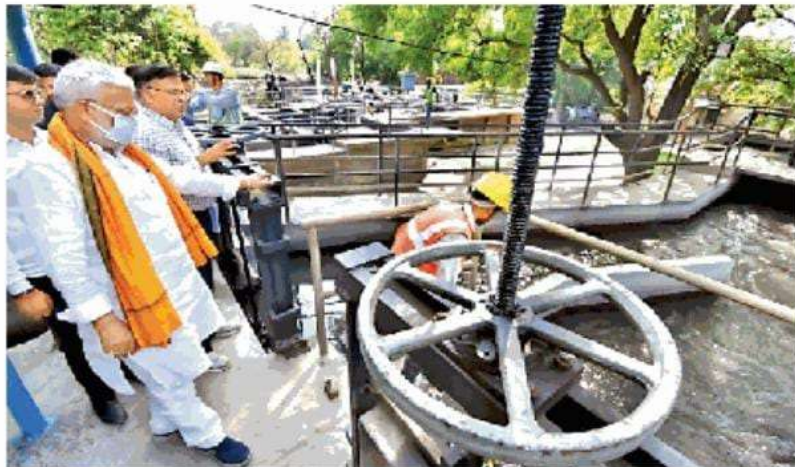
वाजिदपुर स्थित एसटीपी का निरीक्षण करते जल शक्ति मंत्री स्वतंत्र देव सिंह

● समय पर कार्य पूरा न होने पर होगी सख्त कार्रवाई