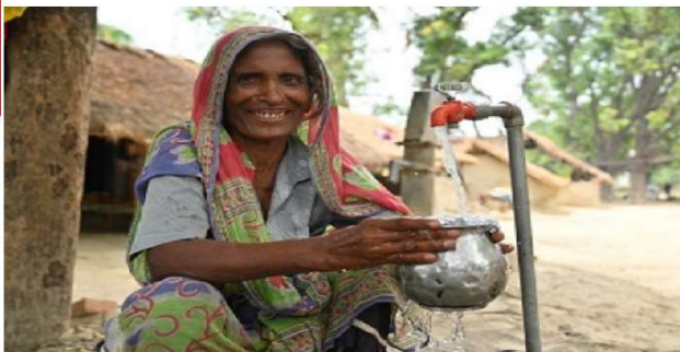
नल कनेक्शन देने में UP Second

नल कनेक्शन देने के मामले में अब यूपी ने महाराष्ट्र को भी पछाड़ा। देश में सबसे अधिक नल कनेक्शन देने वाला दूसरा राज्य बना। यूपी की नजर अब टॉप पर, नल कनेक्शन देने में दूसरे स्थान पर कायम महाराष्ट्र से आगे निकला यूपी। यूपी की इस उपलब्धि पर जल शक्ति मंत्री स्वतंत्र देव सिंह ने नमामि गंगे एवं ग्रामीण जलापूर्ति की पूरी टीम को दी बधाई।