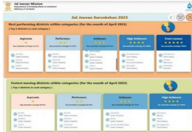
जल जीवन मिशन के राष्ट्रीय सर्वेक्षण में छाया यूपी

डिजिटल डेस्क, लखनऊ। जल जीवन मिशन के मई माह के राष्ट्रीय सर्वेक्षण में यूपी के कई जिले एक से लेकर तीन सितारा तक की विभिन्न श्रेणियों में आए हैं। बेस्ट परफोमिंग कैटेगिरी की तीन सितारा सूची में मेरठ, शाहजहांपुर और पीलीभीत ने स्थान बनाया है। बेस्ट परफोमिंग जिलों में यूपी के अयोध्या, जौनपुर, हरदोई एस्पिरेंट (एक सितारा) और बरेली, श्रावस्ती, बदायूं परफार्मर्स श्रेणी(दो सितारा) की धमक है। यूपी को छोड़कर देश के अन्य राज्यों का कोई भी जिला इस लिस्ट में अपनी उपस्थिति नहीं दर्ज करा पाया है।