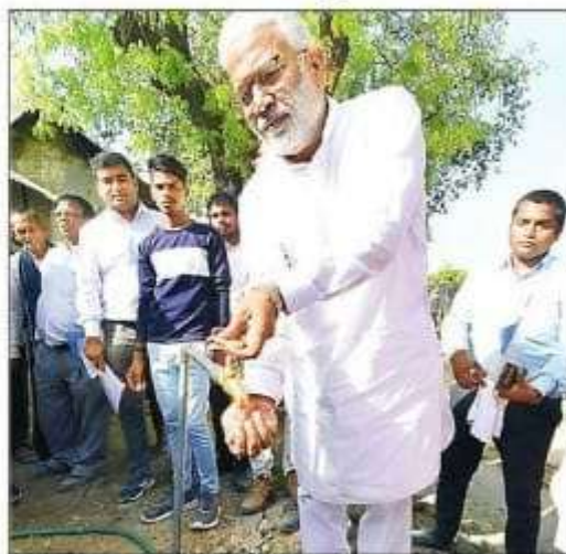
नल के पानी की जांच करते केंद्रीय जल संसाधन मंत्री स्वतंत्र देव सिंह।

इस पर उन्होंने फटकार लगाई और जल्द मार्ग दुरुस्त कराने को कहा। बता दें कि जल जीवन मिशन की हर घर जल योजना के तहत बड़ा गांव परियोजना से 4 राजस्व गांवों की 2500 आबादी को हर घर जल का लाभ दिया जाना है। परियोजना का 80 प्रतिशत काम पूरा भी कर लिया गया है।